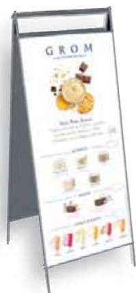
CAVALLETTO DA ESTERNO con rangeboard di prodotto

Strumenti di visibilità da esterno e interno per aiutarti a comunicare il valore del brand.