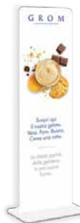
TOTEM DI BRAND