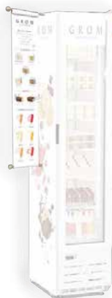
STENDARDO SLIM con rangeboard di prodotto