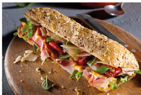
CIABATTINA AI CEREALI 120 G LIEVITO MADRE PRETAGLIATA

Pani cotti su pietra profumati e fragranti