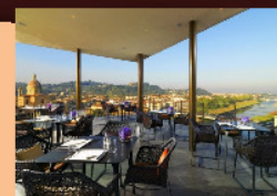
BAR IN CITTA' TURISTICHE