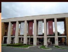
BAR VICINI A UNIVERSITA'

Questa offerta è idonea per diversi tipi di pdv che idealmente dove si fa fatica ad introdurre il gelato Algida