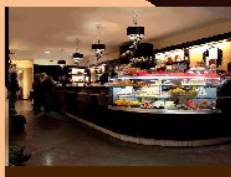
BAR IN CITTA' CON + DI 20K ABITANTI